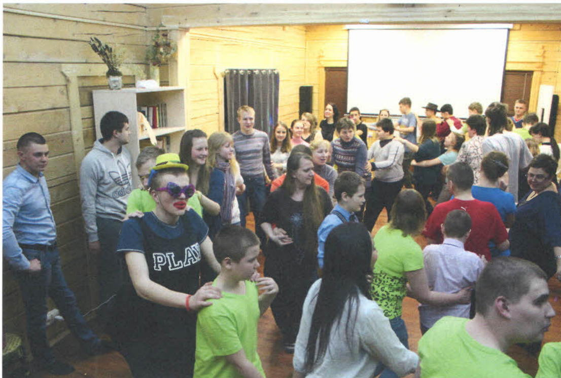
День третий «Танцы». Тематическая вечеринка .

Основная цель таких лагерей не только организация полезного досуга для детей с ограниченными возможностями, но и нормализация и социализация детей с аутизмом. Лагерь позволяет им почувствовать себя обычными школьниками в обычной жизни. Там они учатся выполнять распорядок дня, строго следовать расписанию, общаться, дружить, играть, работать в команде. Этого нельзя добиться даже самыми лучшими занятиями в городских условиях. Загородный лагерь - это интенсив двадцать четыре часа в сутки. С каждым проведенным лагерем мы наблюдаем очень сильный скачок в развитии детей и освоении ими новых навыков. Правильнее будет сказать, что как раз там и происходит прорыв в обучении .