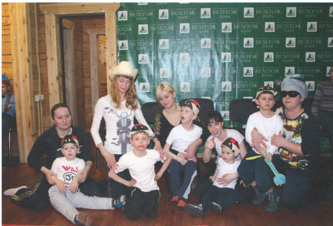
День четвертый .«Мода». Шляпная вечеринка. Пятый отряд,самый младший .

На весенних каникулах мы провели свой десятый , юбилейный, загородный интегративный лагерь сопровождаемого проживания для детей с аутизмом. Участвовало 26 детей с РДА и 8 обычных ( ко-терапевтов). Часть детей более старшего возраста (13 человек) находилась в лагере без родителей, со специалистами и волонтерами. Дети помладше и имеющие более сложные нарушения в развитии были под присмотром мам.